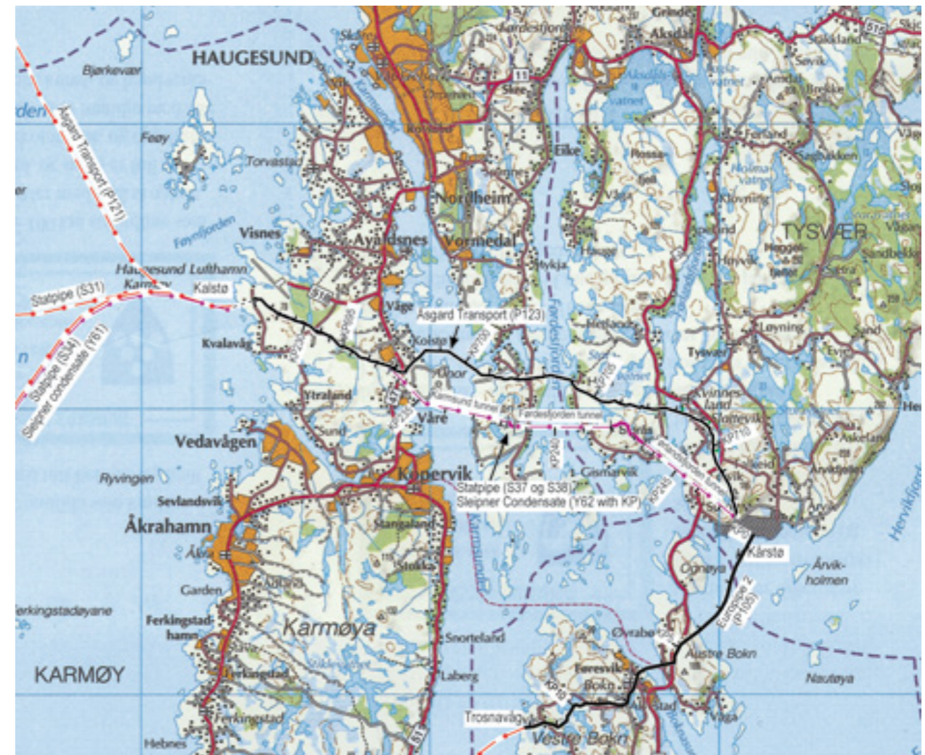
Kart hvor rørledningstraseen er tegnet inn.