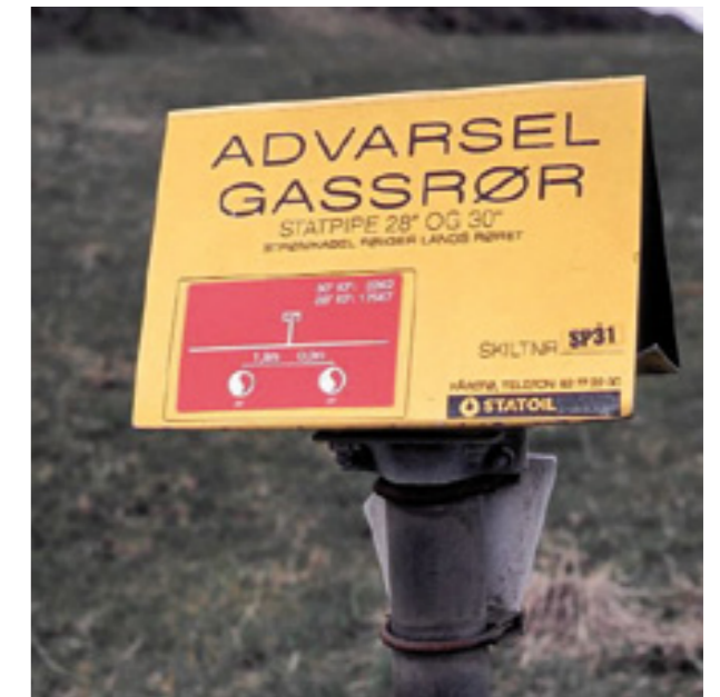
Merking av gassrør langs rørledningstraséen.